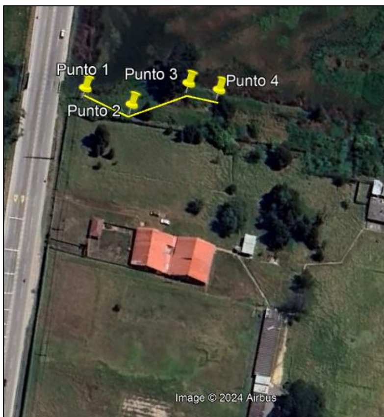
Ilustración 1. Recorrido

Con base en lo anterior, el día 05 de diciembre de 2024 se realizó recorrido de control y vigilancia en el humedal Gualí desde las coordenadas 4°43'34,506" N-74°11'30,114" W hasta las coordenadas 4°43'33,18"N - 74°11'28,158"W (ver ilustración 1. Ruta amarilla) vereda Hato, ecosistema que fue declarado por la Corporación Autónoma Regional de Cundinamarca - CAR como Distrito Regional de Manejo Integrado a través el acuerdo 001 de 2014 "Por medio del cual se declaran como Distrito Regional de Manejo Integrado (DMI), los terrenos comprendidos por los humedales de Gualí, Tres Esquinas y Lagunas de Funzhé, y su área de influencia directa ubicada en los municipios de Funza, Mosquera y Tenjo, Cundinamarca", y estableció tres zonas: 1. Preservación (espejo de agua), 2. Recuperación (50 metros) y 3. Uso sostenible (100 metros).